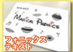
フォニックステキスト

英語学習をはじめたばかりの小学生、中学1年生にはとくに、英単語学習の土台となるフォニックス(文字と発音の関係から、英語の正しい読み方を学ぶ方法)に力を入れています。これにより、英単語を「書けるけど読めない、読めるけど書けない」といった状態を防ぐことができます。また、英語は「分かっていたら解ける」というものではありません。教わったことを自分の身体と頭に染みこませ、瞬時にアウトプットするための反復練習が得点力を左右します。進学塾unitでは少人数での指導環境を活かし、塾生一人一人の演習ノートを細かくチェックします。