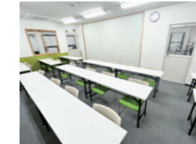
授業時はブラインドカーテンで 教室間が仕切られます。

清潔感、開放感のある、明るい空間です。 壁や机は白で統一し、椅子は癒しの緑、温かみのあるオレンジを取り入れています。掲示物を最低限にすることで、視覚的に落ち着くように設計した空間です。3階なので騒音もなく静かです。また、座席どうしの間隔を広く取っているため、自分の学習スペースをしっかりと確保できます。過ごしやすい空間で、思う存分勉強しましょう。